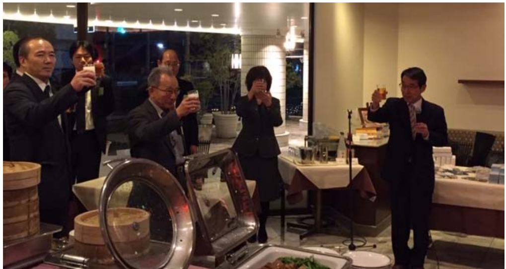
懇親会 CERI 四角目理事による乾杯