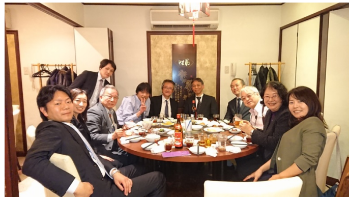
最終日の横浜探訪ツアー後の懇親会の集合写真