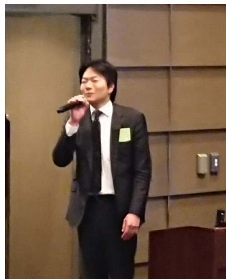
橘田氏 (現地世話人) の挨拶