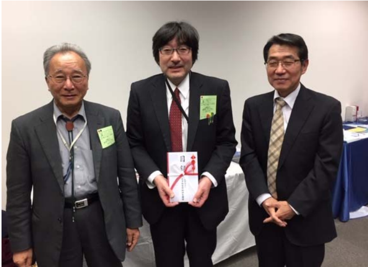
2019年度 CERI クロマトグラフィー分析賞 (中央：日立ハイテクサイエンス 伊藤氏)