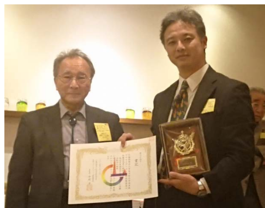
2019年液体クロマトグラフィー努力賞 (加藤氏)