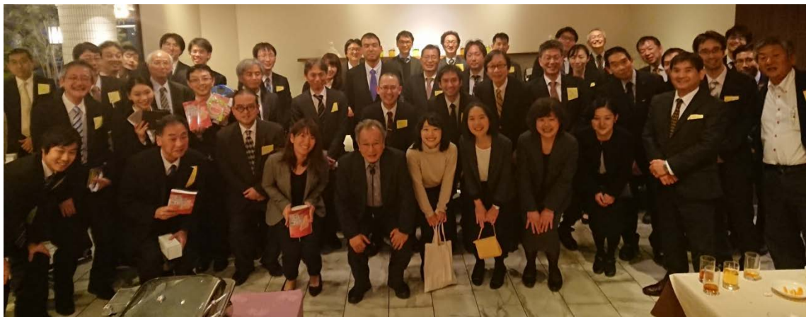
懇親会の集合写真